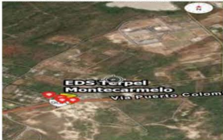
Ilustración 3: Puntos tomados en la visita técnica