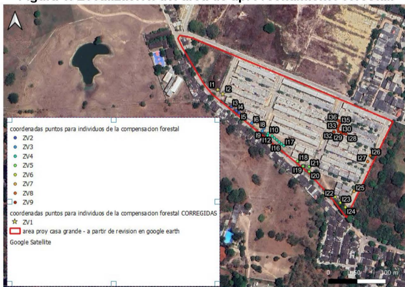
Figura 1. Localización del área de aprovechamiento forestal.