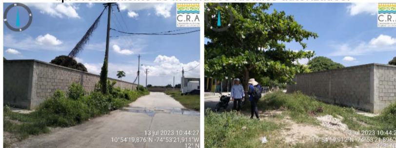
Figura 2 y 3. Registro fotográfico del sector noroeste del proyecto, donde no se realizó el aprovechamiento de individuos fustales autorizados.