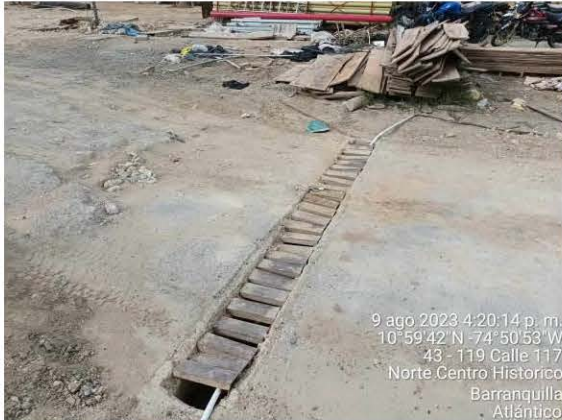
Sistema para el drenaje y control de sedimentos transportados de las actividades y aguas lluvias.

AUTO No 1206 DE 2023 POR MEDIO DEL CUAL SE HACEN UNOS REQUERIMIENTOS A LA SOCIEDAD CONSTRUCTORA BOLIVAR S.A. CON NIT 860.513.493-1