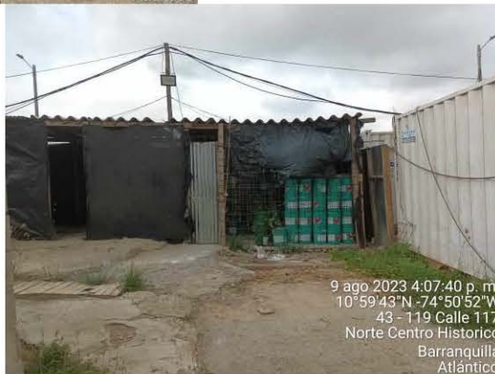
Centro de acopio para almacenamiento de RESPEL.