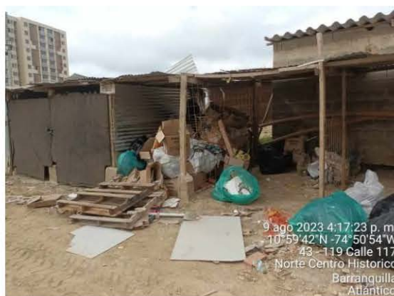
Centro de acopio, para almacenamiento de plástico, madera, chatarra y cartón.