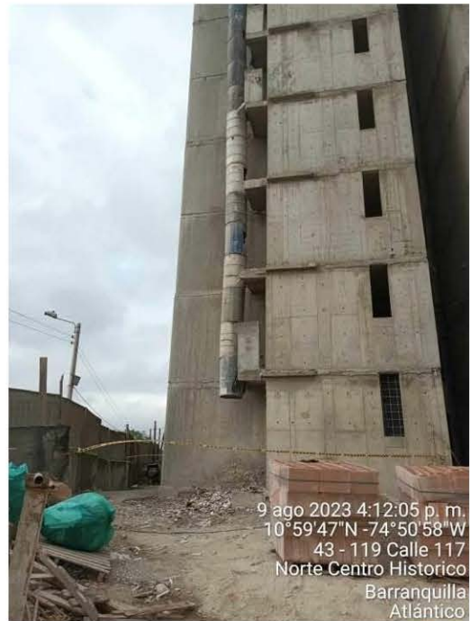
Shute para desalojo de los RCD producto de los trabajos realizado en las torres de apartamentos