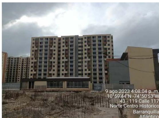
Torre de apartamentos terminados para ser habitados.