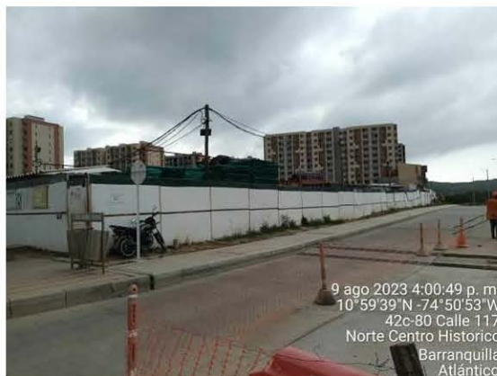
Cerramiento del proyecto en lamina, para prevenir el ingreso de personas ajenas al proyecto.