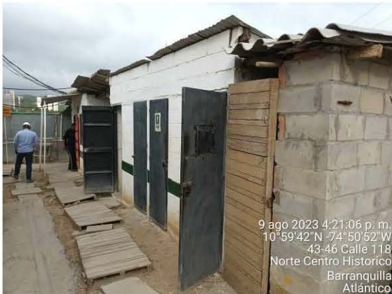
Baños fijos para los empleados de la obra, conectados al alcantarillado. →