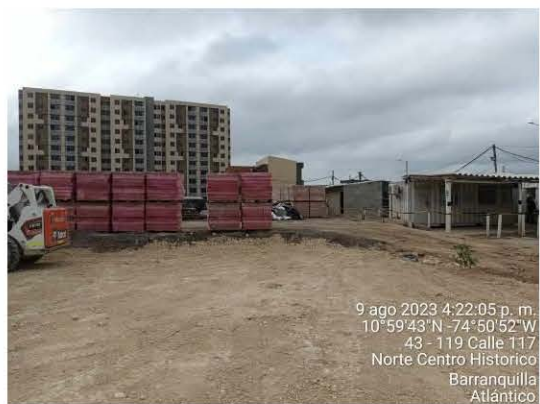
Vista interior del proyecto, en el cual se construirán las cuatro (4) torres que faltan.