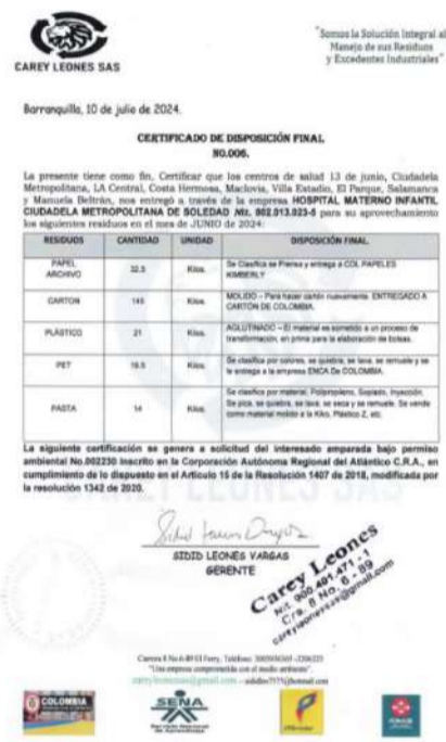
Imagen 4 Certificado de disposición final de la empresa encargada de la recolección de los residuos reciclables generado en ESE Hospital Materno Infantil ciudadela metropolitana de soledad- Centro de Salud Salamanca