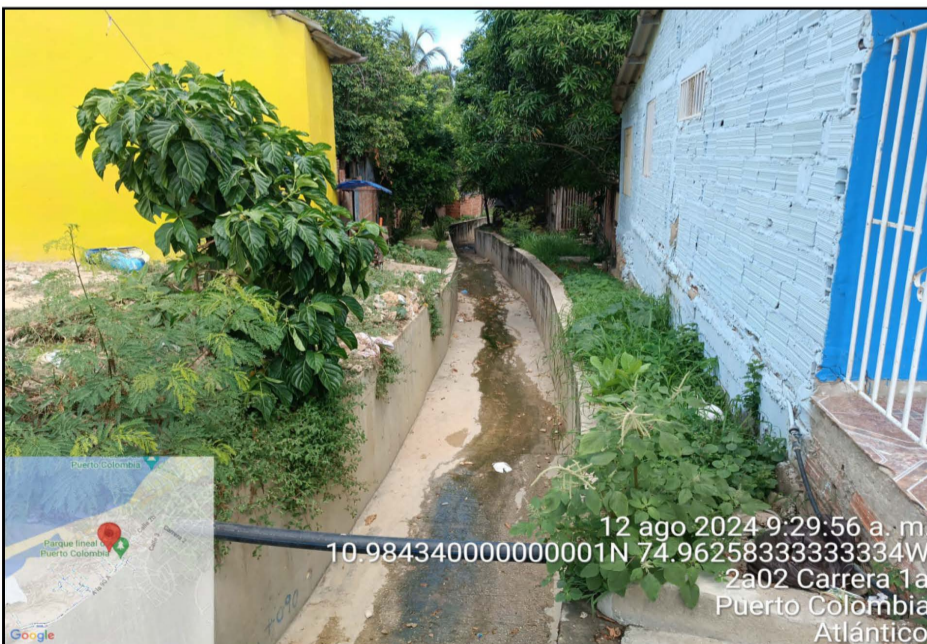
Foto N° 2 Fecha: 12 de agosto del 2024. Ubicación: Arroyo vista mar Puerto Colombia - Atlántico. Observaciones: Canal 1.