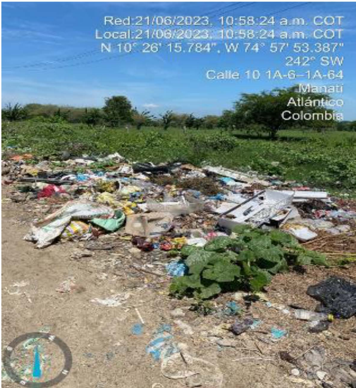
Foto No.3 Punto crítico de disposición de residuos ubicado en la calle 10 # 1 A – 6.

“POR MEDIO DEL CUAL SE EFECTÚA EL SEGUIMIENTO Y CONTROL AMBIENTAL AL PLAN DE GESTIÓN INTEGRAL DE RESIDUOS SÓLIDOS GENERADOS DEL MUNICIPIO DE MANATÍ, IDENTIFICADO CON NIT 800.019.218-4”