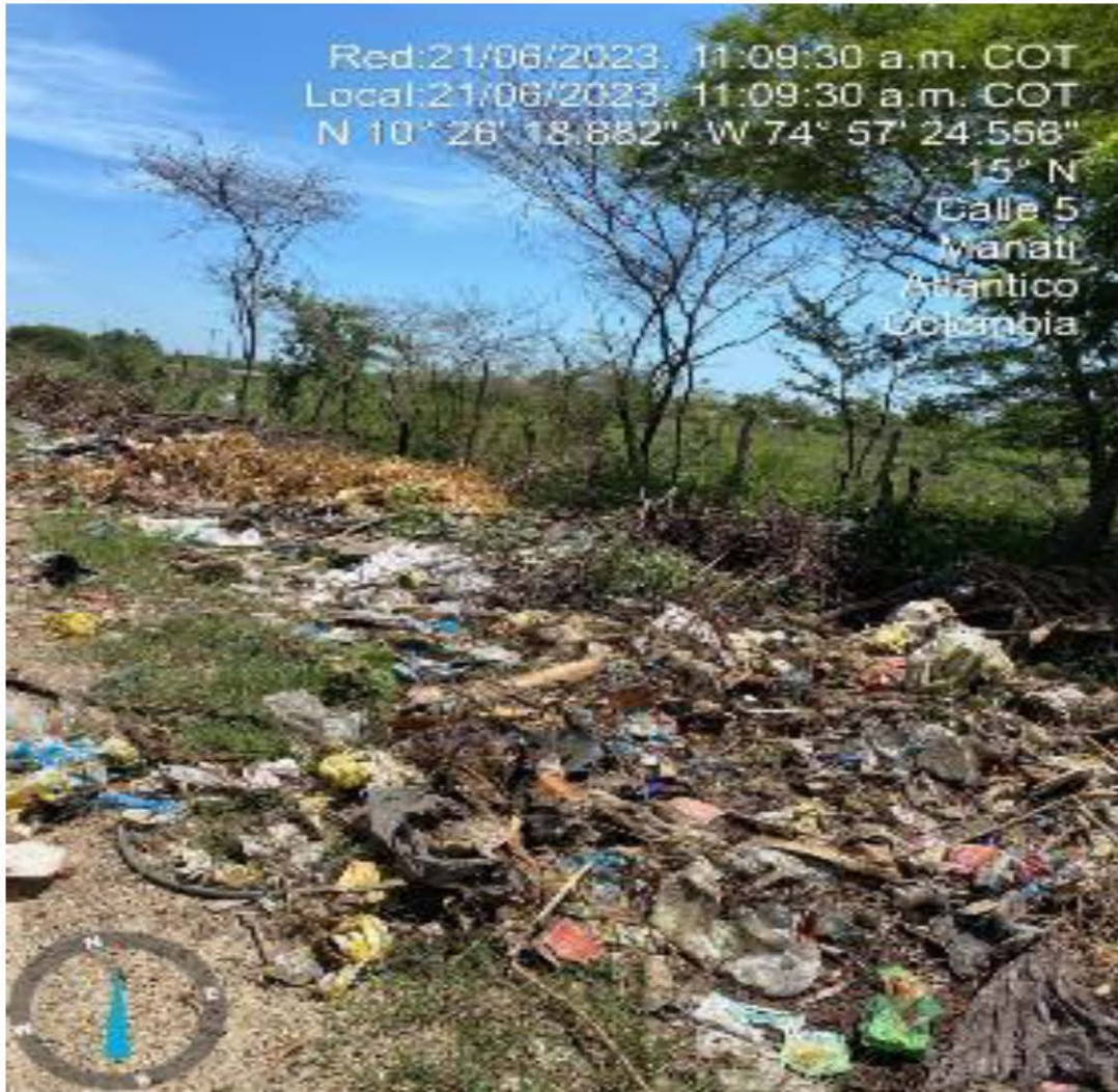
Foto No.4 Punto crítico de disposición de residuos ubicado en la calle 5.

“POR MEDIO DEL CUAL SE EFECTÚA EL SEGUIMIENTO Y CONTROL AMBIENTAL AL PLAN DE GESTIÓN INTEGRAL DE RESIDUOS SÓLIDOS GENERADOS DEL MUNICIPIO DE MANATÍ, IDENTIFICADO CON NIT 800.019.218-4”