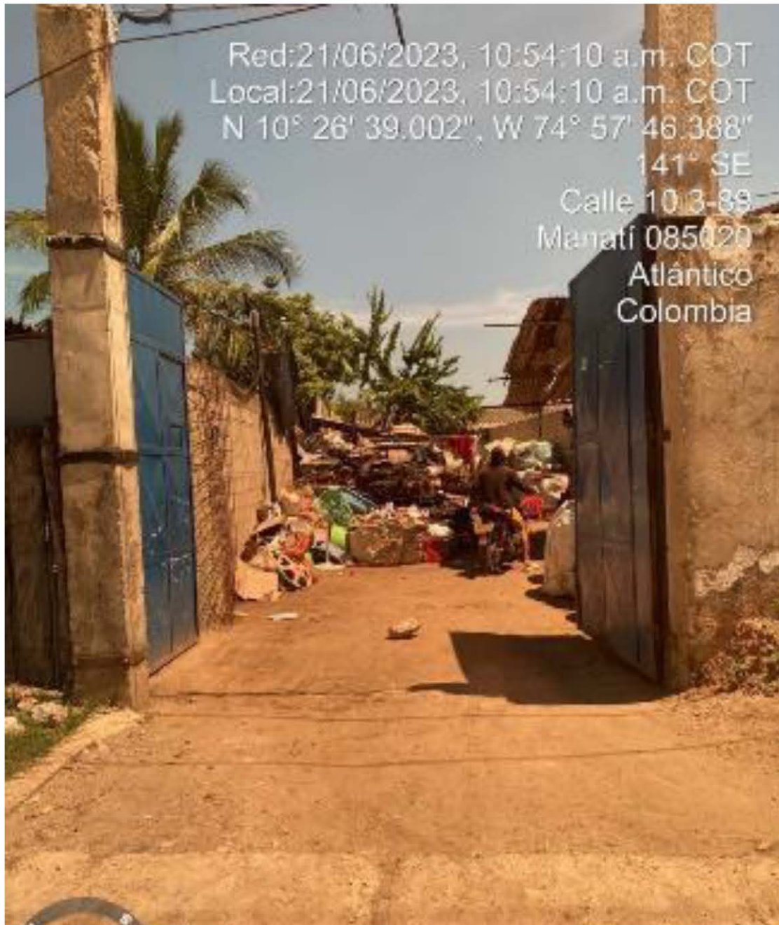
Foto No.2 Punto de aprovechamiento de residuos – municipio de Manatí.

“POR MEDIO DEL CUAL SE EFECTÚA EL SEGUIMIENTO Y CONTROL AMBIENTAL AL PLAN DE GESTIÓN INTEGRAL DE RESIDUOS SÓLIDOS GENERADOS DEL MUNICIPIO DE MANATÍ, IDENTIFICADO CON NIT 800.019.218-4”