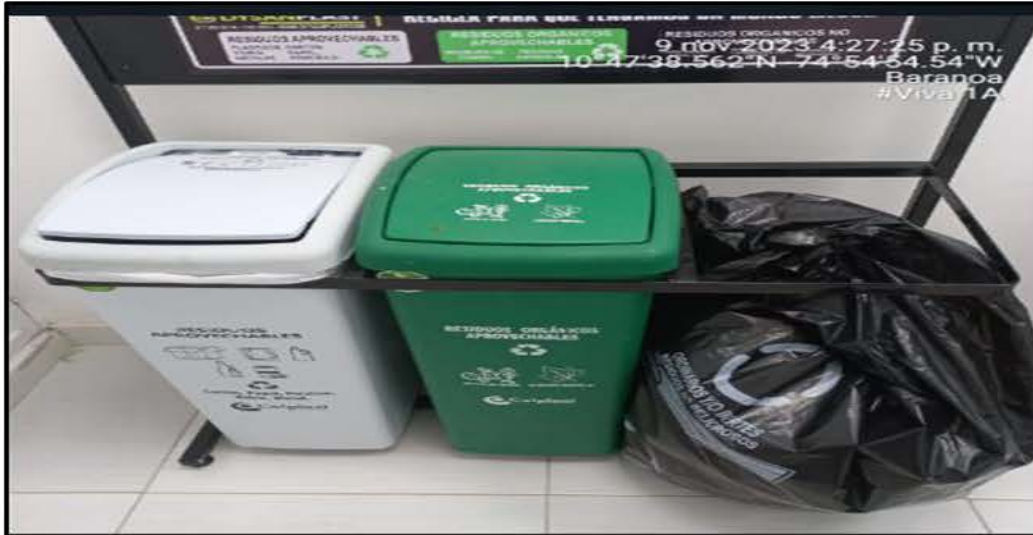
Imagen 2 Punto Ecologico, IPS VIVA 1 A, ubicado en el municipio de Baranoa

POR MEDIO DEL CUAL SE HACEN UNOS REQUERIMIENTOS A LA SOCIEDAD VIVA 1 A I.P.S. S.A., IDENTIFICADA CON NIT 900.219.120-2