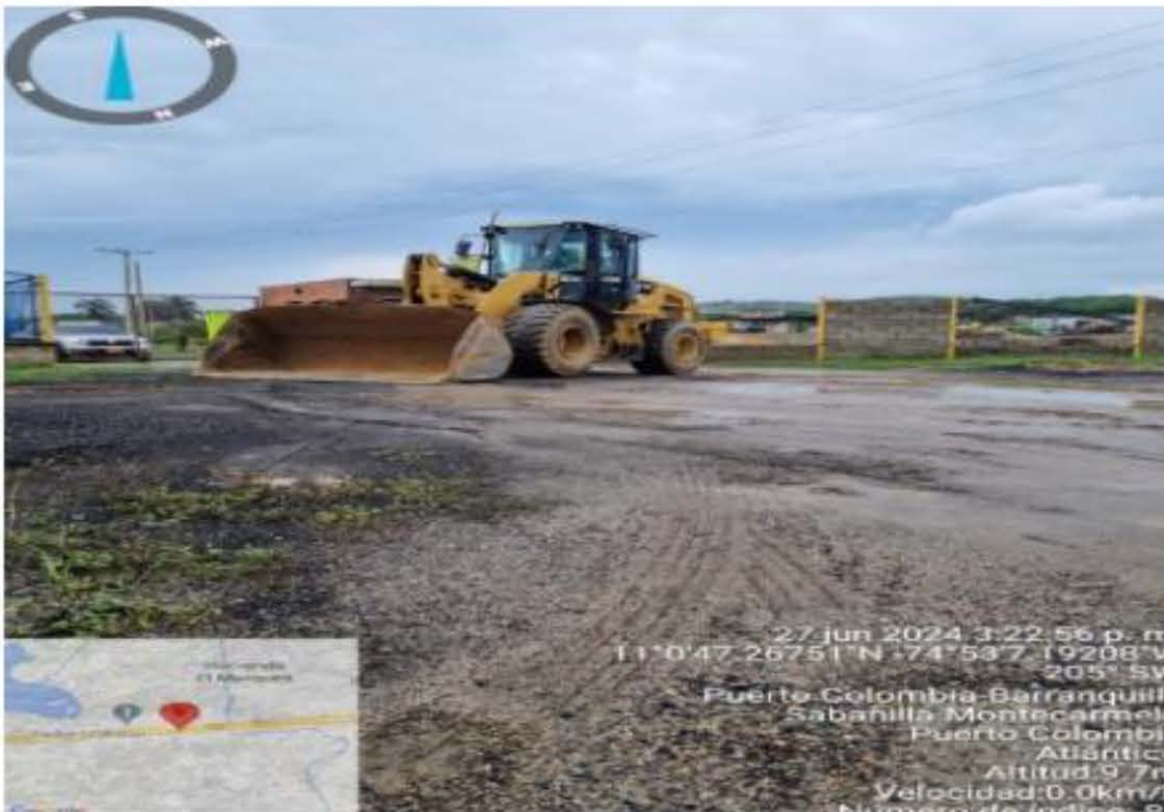
Ilustración 4 extensión de asfalto en la entrada