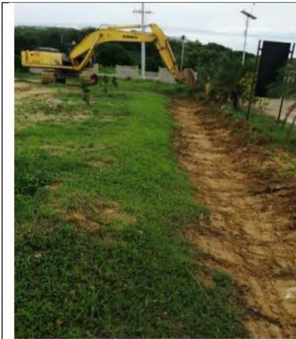
Ilustración 6 Mantenimiento de cunetas