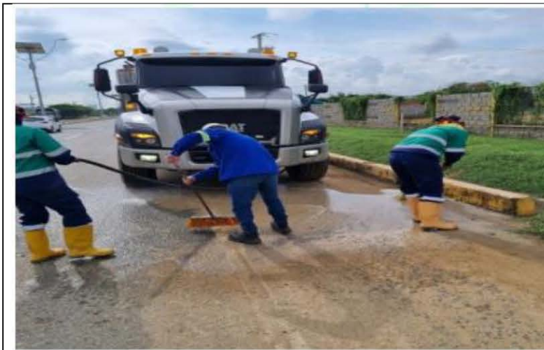
Ilustración 3 Limpieza de material particulado.