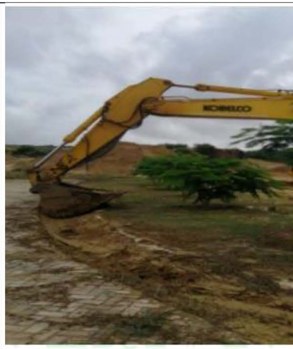
Ilustración 7 Mantenimiento de

Finalmente, denuncia que, en el PR104, una empresa indeterminada realiza extracción y comercialización de material y afecta de mayor forma la vía al mar, al presentarse las fuertes lluvias dichos sedimentos se acumulan en sentido a barranquilla y de esta forma están afectando de mayor manera la carretera. Se adjuntan evidencias con coordenadas fecha y hora.