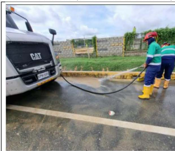
Ilustración 1 lavado de vía al mar.

"La empresa INVERHAV SAS, a través de su operador minero, ha venido realizando labores de barrido en la intersección de la vía al mar. Se informa a la autoridad que los lavados se llevan a cabo de manera programada, con el objetivo de evitar que la vía esté cubierta de material particulado. Lo anterior queda evidenciado en las imágenes adjuntas."