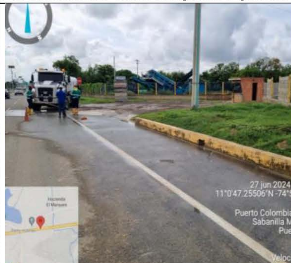
Ilustración 2 Limpieza de material particulado.