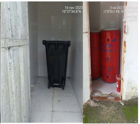
Imagen 3 Área de almacenamiento intermedia para la recolección de los residuos generados en la IPS SAIS