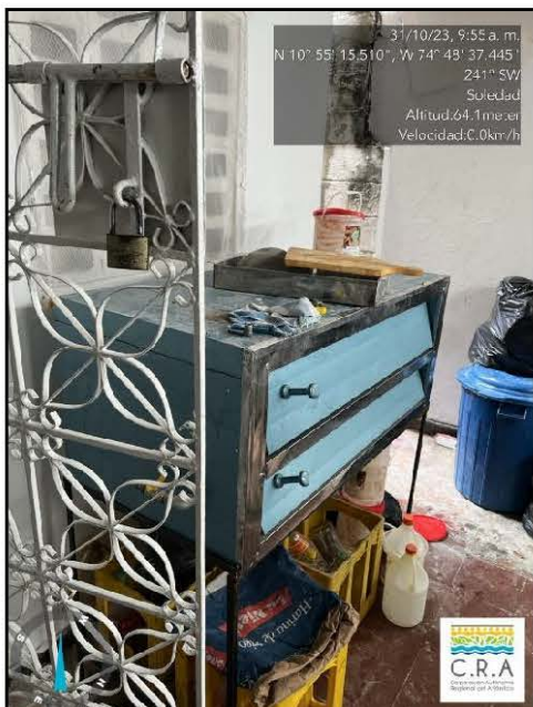
Fotografía 1. Horno para pizza existente