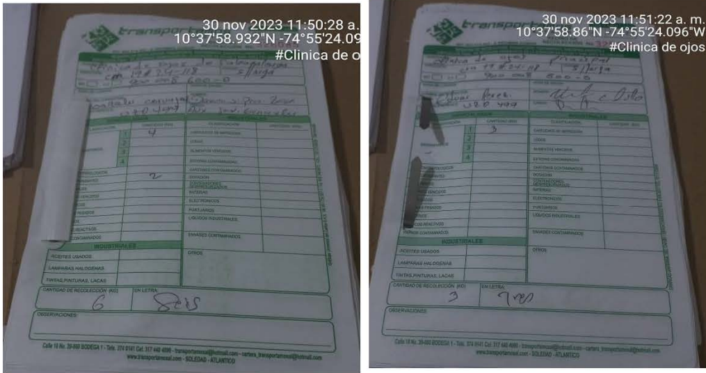
Imagen 1 Manifiesto de recolección de los residuos generados por la Clínica de ojos de Sabanalarga

POR MEDIO DEL CUAL SE HACEN UNOS REQUERIMIENTOS A LA SOCIEDAD CLÍNICA DE OJOS DE SABANALARGA LTDA, IDENTIFICADA CON NIT 900.008.600-0