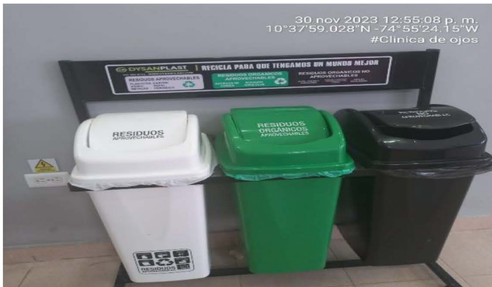
Imagen 4 Punto ecológico para la recolección de los residuos generados en la Clínica de ojos

Los residuos peligrosos generados son embalados, envasados y rotulados según el tipo de residuo generado; estos son etiquetados con fecha, área y cantidad cumpliendo con el código de colores vigente; así como lo establece el Artículo 2.8.10.6 Numeral 11 del Decreto 780 del 6 de mayo del 2016.