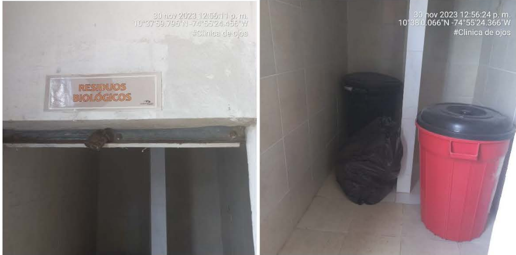
Imagen 4 Área central para la recolección de los residuos peligrosos de riesgo biológico y residuos No aprovechables

POR MEDIO DEL CUAL SE HACEN UNOS REQUERIMIENTOS A LA SOCIEDAD CLÍNICA DE OJOS DE SABANALARGA LTDA, IDENTIFICADA CON NIT 900.008.600-0