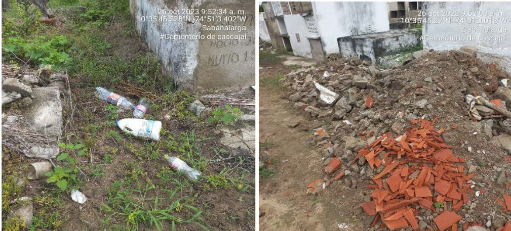
Imagen 3 Residuos No aprovechables disperso en el piso al interior del cementerio de Cascajal – Municipio de Sabanalarga

POR MEDIO DEL CUAL SE HACEN UNOS REQUERIMIENTOS AL MUNICIPIO DE SABANALARGA, IDENTIFICADO CON NIT 800.094.844-4, EN RELACIÓN CON EL CEMENTERIO DEL CORREGIMIENTO DE CASCAJAL