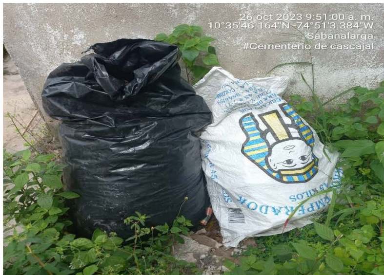
Imagen N° 2 Residuos peligroso (procesos de exhumación) del cementerio del corregimiento Cascajal Atlántico

El Cementerio del corregimiento de la Cascajal; hasta la fecha no ha contratado los servicios de una empresa especializada para la recolección, transporte y la disposición final de sus residuos sólidos generados en el desarrollo de su actividad (procesos de exhumación) estos son dispuestos en sacos para posteriormente ser Quemados a cielo abierto