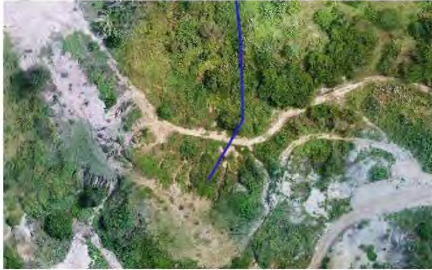
Ilustración No 4_ Detalle ortomosaico ilustración No 3