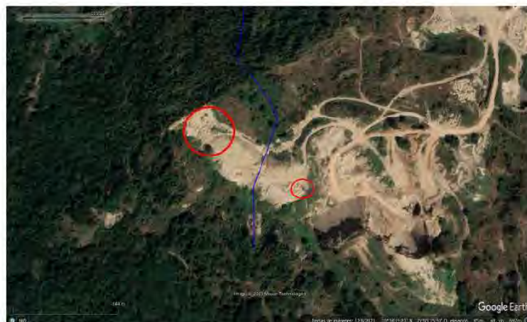
Ilustración No 7 fotografía 2018. Momento de la Afectación al área donde se encontraba el afluente del arroyo. Sanción impuesta por la CRA