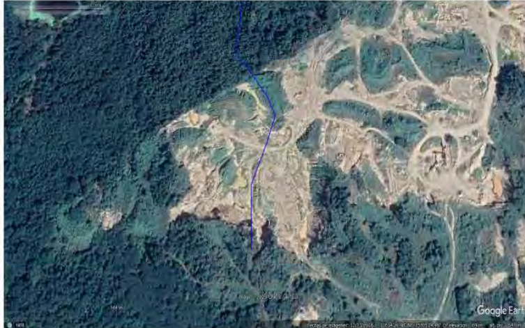
Ilustración No 6 Fotografía 2018 Momento de la Afectación al área donde se encontraba el afluente del arroyo. Sanción impuesta por la CRA.

realizado de manera paulatina debido a las condiciones de pandemia ocurridas en los años 2020-2021, y las condiciones económicas del mercado.