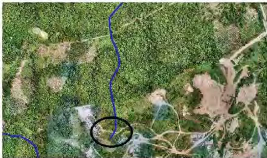
Ilustración No 3_ Ortomosaico (2023) con tributario

Para constatar la existencia de algún tributario en la zona marcada por el auto 468 de 2023, se georreferencio la imagen y se trasladó al software libre con un ortomosaico reciente (agosto 6 de 2023), en donde se aprecia de manera clara que las zonas actualmente explotadas, no afectan los tributarios referidos en el auto arriba mencionado (ver ilustración No 3, No 4 y No 5).