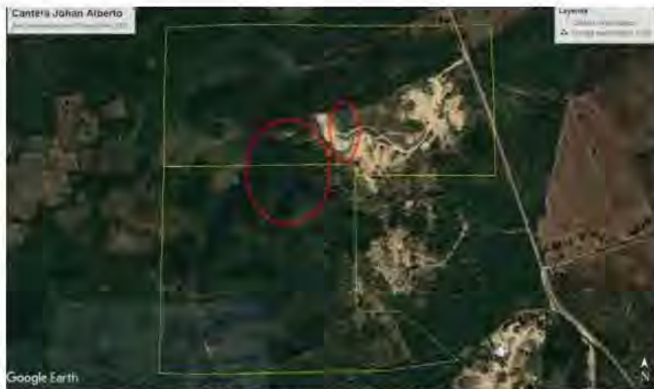
Ilustración No 2_ Imagen en auto No 468 de 2023

4. En relación con “... por haber realizado intervención del cauce natural del afluente del arroyo Guasimo, sin contar con el permiso de ocupación de cauce otorgado por la autoridad ambiental e incumplimiento con ello el artículo segundo de la Resolución No 639 de 2010, con fundamento en las consideraciones expuestas en la parte motiva de este auto y en los términos del artículo 5 y 18 de la ley 1333 de 2019”