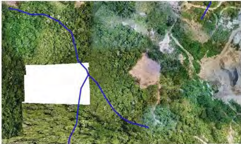
Ilustración No 5_ Ortomosaico (2023) con tributarios

Ahora bien, se debe aclarar que en ocasión anterior se inició-mediante Auto No 1432 de 2011- un proceso sancionatorio por la afectación en el área donde se localiza el tributario del arroyo Guásimo, en la cual se me sancionó con multa y la obligación de recuperar y restaurar la zona considerada por ustedes intervenida.