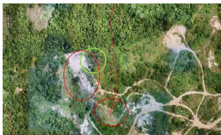
Ilustración No 8 Fotografía 2023 Círculos Rojos Áreas De Recuperación morfológica, Círculo Verde área Con Siembra De Planta Para La Recuperación Forestal y línea Roja, Encausamiento Del Afluente de Arroyo Guasimo, Fotografía

Es así como, considerando, que se están teniendo en cuenta las mismas circunstancias para iniciar nuevamente un proceso sancionatorio, me permito solicitar se verifiquen los siguientes hechos: