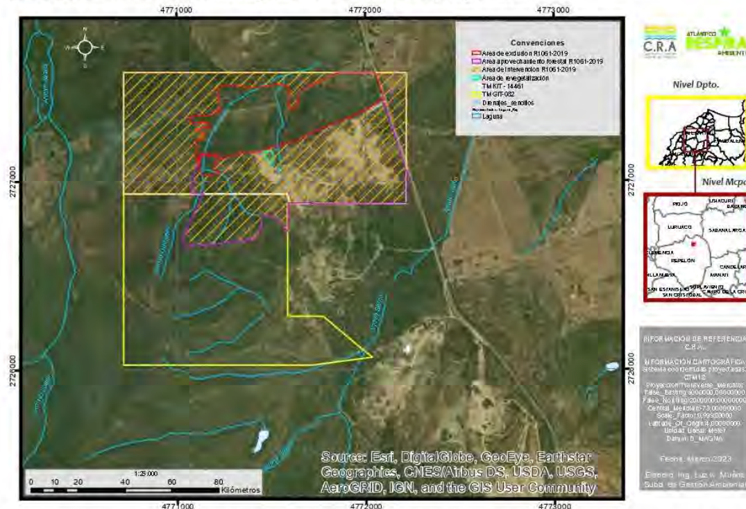
Ilustración 1: Localización general del área de proyecto.