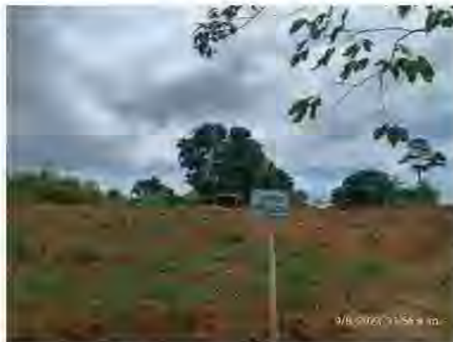
Ilustración No 1_ Demarcación de la zona correspondiente a las 0,33 ha

Atendiendo a que uno de los aspectos encontrados en la visita técnica de la CRA, llevada a cabo el 29 de marzo del 2023, relacionados con la intervención de 0,33 Ha; equivalente a un valor menor al 1% (exactamente a 0,39%) del polígono licenciado, se informa que esta intervención se ocasionó debido en gran parte a la sincronización accidental en el cambio del sistema de proyección Magna Sirgas Origen Nacional (CTM12 - EPSG 9377), con el anterior sistema de proyección (origen Bogotá - EPSG 3116), área en donde se desarrollaron actividades de tránsito de maquinaria y no de explotación de material como lo establece en el informe de seguimiento. Desde la fecha en la cual se realizó la visita a la Cantera Johan Rivera, se suspendió todo paso de tránsito de la maquinaria sobre las 0,33 ha, por ello es importante que los funcionarios de la autoridad ambiental verifiquen mediante visita de campo que en el área no se realizó extracción de material y que actualmente se encuentra en proceso de recuperación de la cobertura vegetal para lo cual se está realizando: Rehabilitación del área mediante el establecimiento de 206 individuos arbóreos, de mínimo 1,5 metros de altura y sembrados en forma rectangular a una distancia de siembra de 4 m, de igual manera se procedió a demarcar la zona para evitar que los operarios entren a la misma.