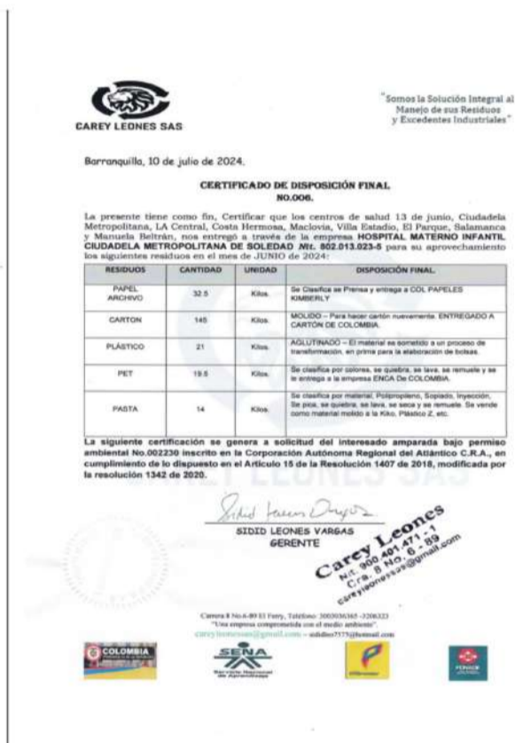
Imagen 2. Manifiesto de disposición final de la sociedad CAREY encargada de la recolección de los residuos reciclables.

La Empresa Social del Estado Hospital Materno Infantil Ciudadela Metropolitana de Soledad Centro de Salud 13 de junio, ha contratado los servicios de la empresa Servicios Ambientales Especiales SAE S.A E.S.P, contrato de prestación de servicio N.º NCD 160/2024 con fecha de inicio de 7 de julio de 2024 al 31 de diciembre 2024, para la recolección, transporte y la disposición final de sus residuos hospitalarios con una frecuencia de recolección de 3 veces a la semana (lunes martes y viernes ), durante la visita presentó las evidencias de las licencias, permisos y/o autorizaciones ambientales de la empresa especializada encargada de su recolección Resolución 0223 del 10 de Marzo de 2015.