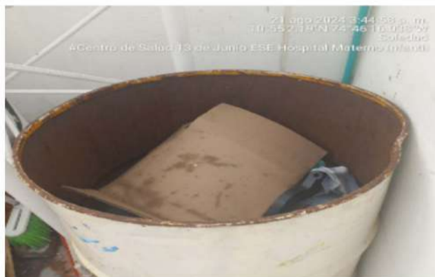
Imagen No 1 Área de almacenamiento central para la recolección de los residuos Peligrosos de riesgo biológico y área de los residuos No aprovechables y residuos reciclables

POR MEDIO DE LA CUAL SE HACEN UNOS REQUERIMIENTOS A LA ESE MATERNO INFANTIL CIUDADELA METROPOLITANA DE SOLEDAD, IDENTIFICADA CON NIT 802.013.023-5, EN RELACIÓN CON EL CENTRO DE SALUD 13 DE JUNIO