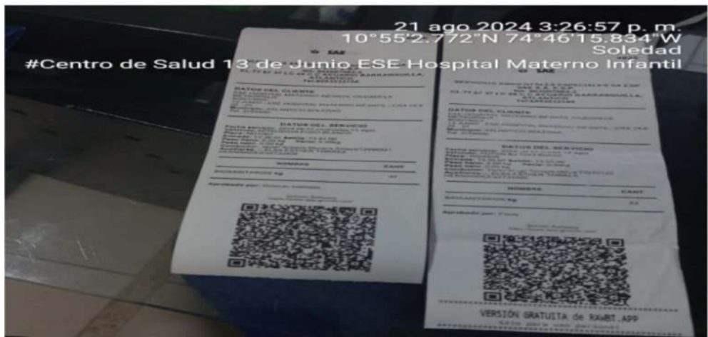
Imagen 6 Manifiesto de recolección de los residuos generados por la Empresa Social del Estado Hospital Materno Infantil Ciudadela Metropolitana de Soledad Centro de Salud 13 de junio.

Los residuos hospitalarios generados son pesados diariamente, este pesaje es consignado en los Formatos RH1