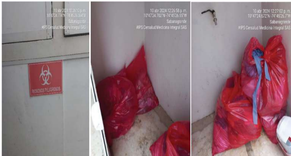
Imagen 4 Área de almacenamiento para la recolección de los residuos peligrosos de riesgo biológico generados en la IPS Cersalud Medicina Integral SAS, dispuestos en él, piso.

“POR MEDIO DE LA CUAL SE HACEN UNOS REQUERIMIENTOS A LA SOCIEDAD I.P.S. CERSALUD MEDICINA INTEGRAL S.A.S., IDENTIFICADA CON NIT No. 901.266.096-7”