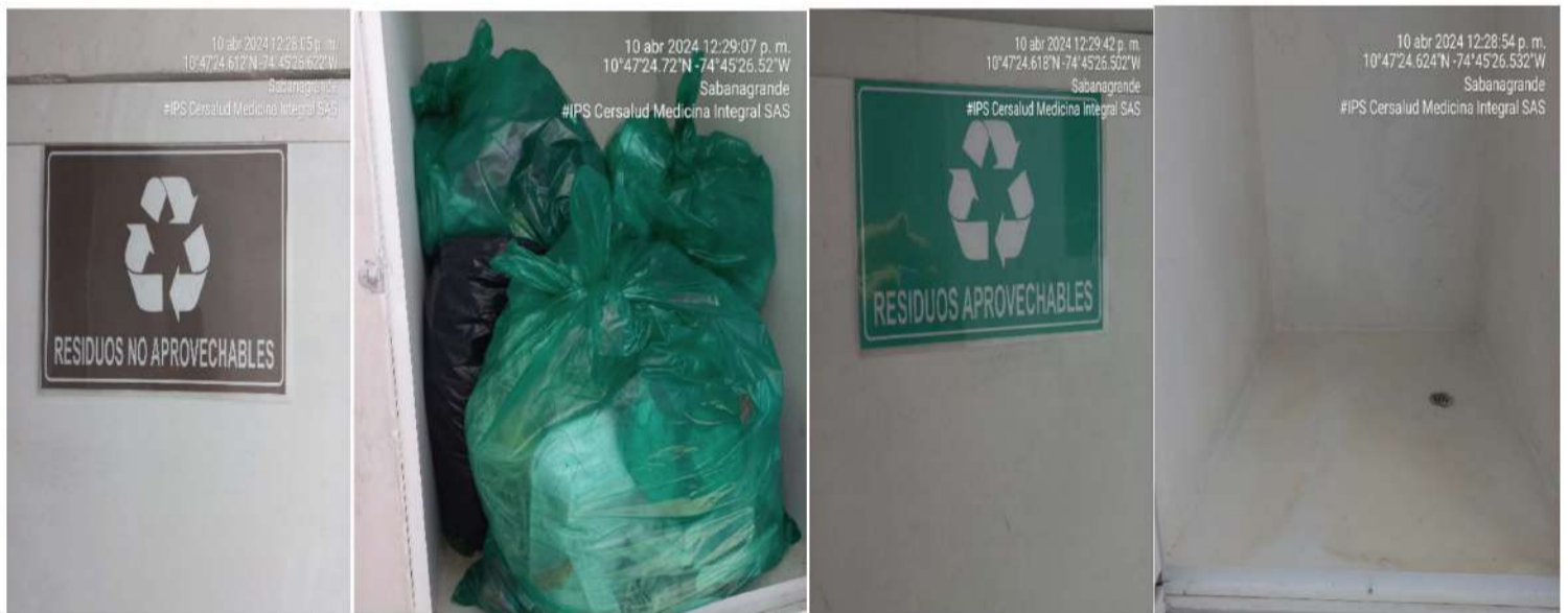
Imagen 5 Área de almacenamiento para la recolección de los residuos No aprovechables y Orgánicos Aprovechables generados en la IPS Cersalud Medicina Integral SAS, dispuestos en él piso, sin recipiente conforme al código de colores vigente.

Los vertimientos generados en la IPS provienen de las actividades diarias desarrolladas, estas son vertidos al sistema de alcantarillado del municipio de Sabanagrande.