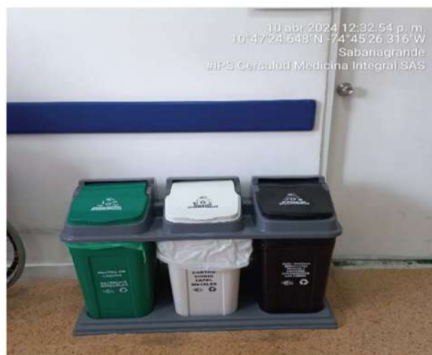
Imagen 4 Recipientes para los residuos orgánicos aprovechables, aprovechables y no aprovechables conforme al Código de Colores.

En cuanto a las bolsas para realizar la recolección de los residuos no se encuentran, rotuladas ni etiquetadas según el tipo de residuo generado solo separados según el código de colores.