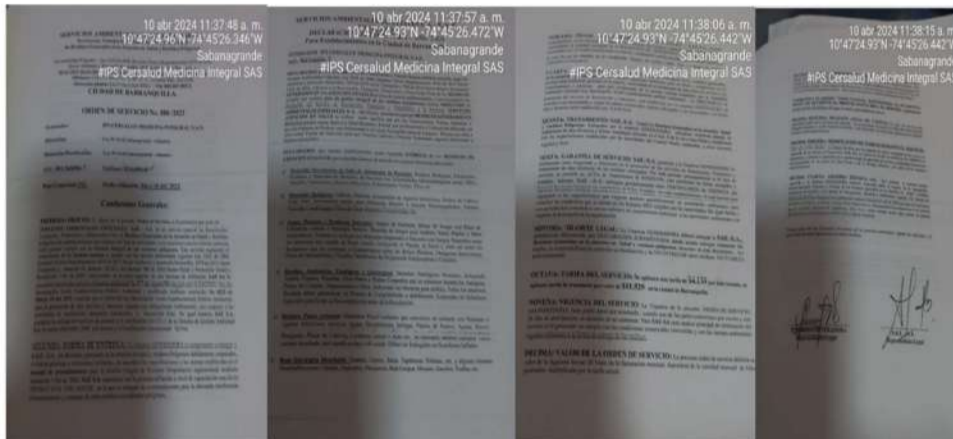
Imagen 3 Contrato suscrito con la empresa SAE y la IPS Cersalud Medicina Integral SAS del Municipio de Sabanagrande. – Atlántico

“POR MEDIO DE LA CUAL SE HACEN UNOS REQUERIMIENTOS A LA SOCIEDAD I.P.S. CERSALUD MEDICINA INTEGRAL S.A.S., IDENTIFICADA CON NIT No. 901.266.096-7”